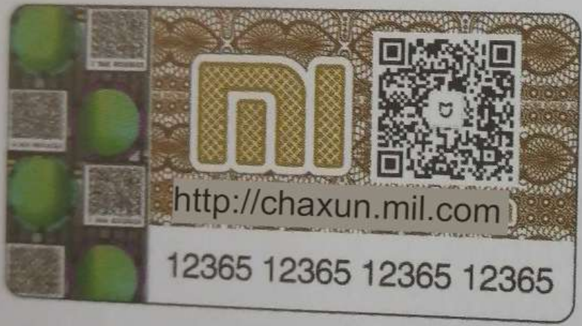
Принципиальная схема после открытия