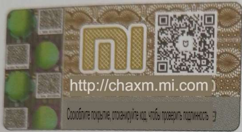
Принципиальная схема этикетки для защиты от подделки