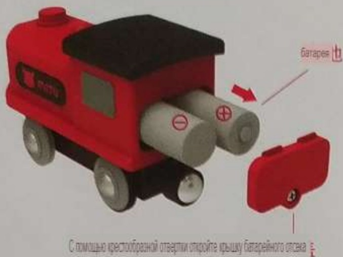
С помощью крестообразной отвертки откройте крышку батарейного отсека