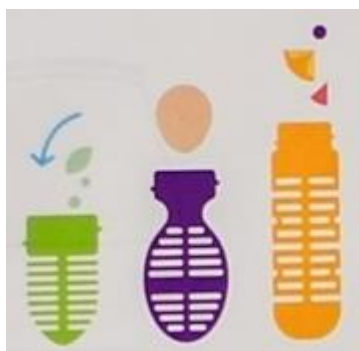
2. Добавьте ингредиенты