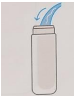
4. Налейте воду в стакан воды