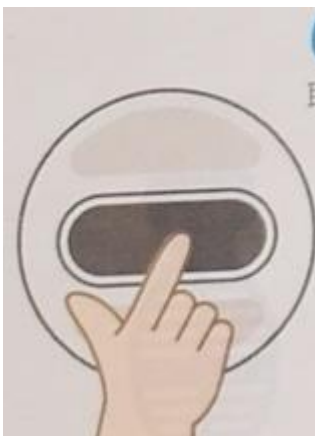
6. Встряхните термос