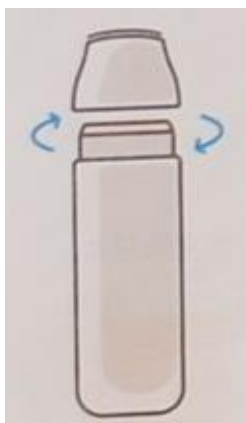
5. Закройте крышку