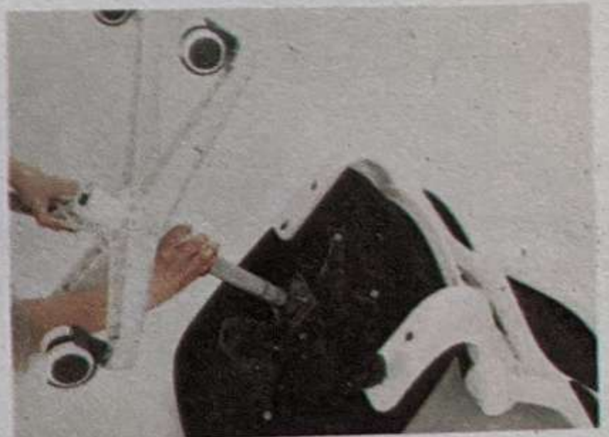
6 Вставьте основание стула в механизм наклона , как показано на рисунке /