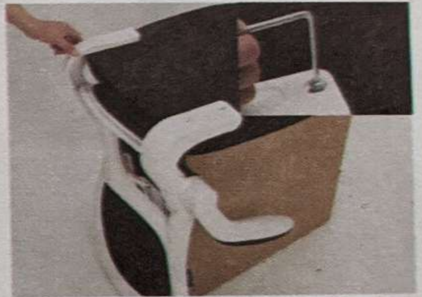
4. Установите спинку и подлокотник, как показано на рисунке, и закрепите их винтом В