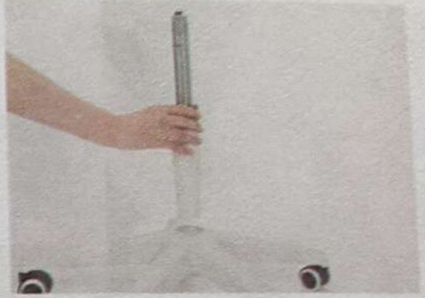
2. Вставьте цилиндр в середину основания стула