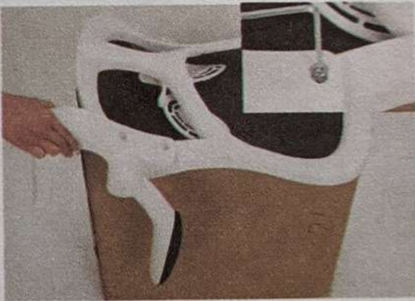
3. Установите подлокотник, как показано на рисунке и закрепите его винтом В