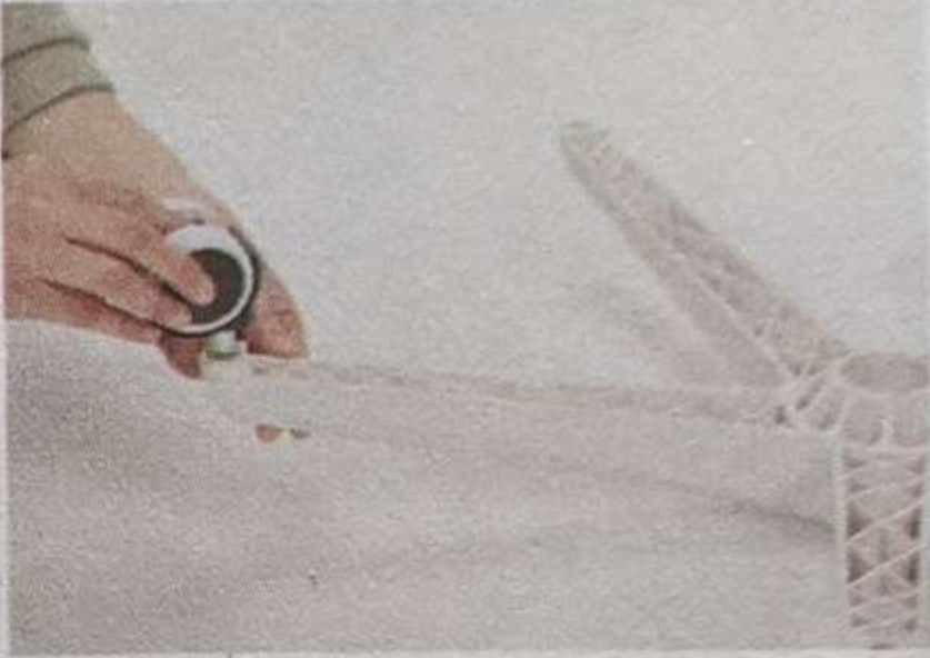
1 Вставьте колеса в ножку на основании стула