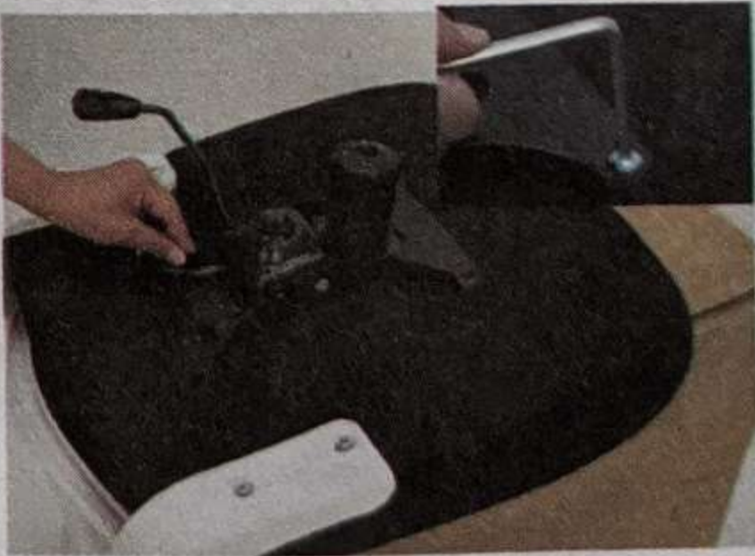
5 Установите механизм наклона, как показано на рисунке , и закрепите винтом А